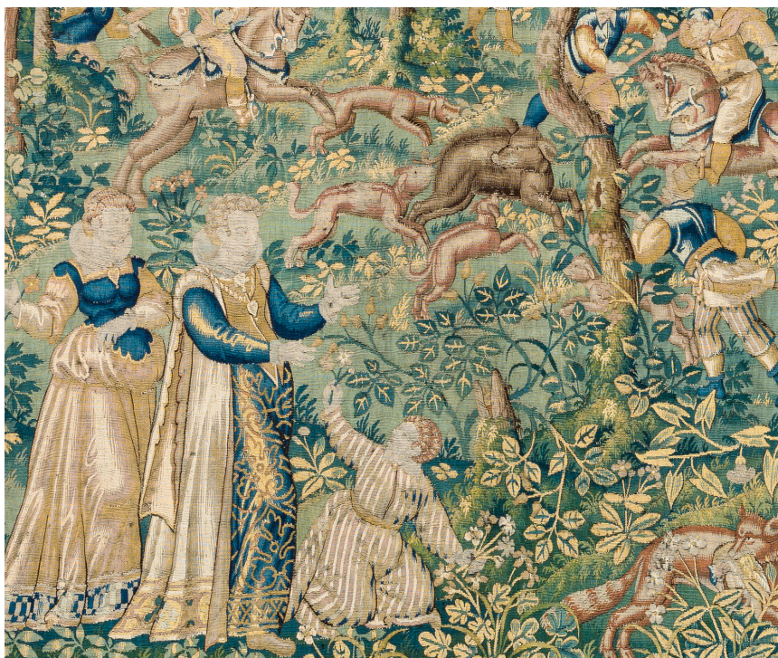
Tapisérie žánr šlechtické zábavy hedvábí, vlna 2. polovina 16. století / Belgie, Audenarde