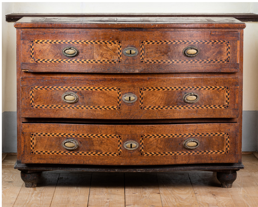
Komoda třízásuvková, s páskovou intarzií dřevo, bronz začátek 19. století / severní Čechy