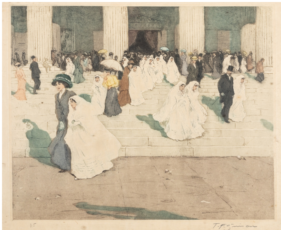
Šimon Tomáš František: Schodiště divadla s vycházející společností akvatinta na papíře 1909 / Francie, Paříž

Zahraniční spolupráce se týká i univerzit, jejich pracoviště se zabývají výzkumem provenience, např. Freie Universität , Německo; University of Gdańsk , Polsko; University of Toronto , Kanada.