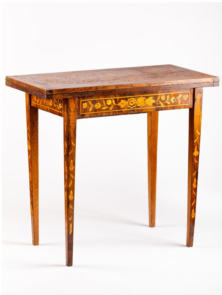
Stolek hrací dřevo, plst konec 18. století / střední Evropa