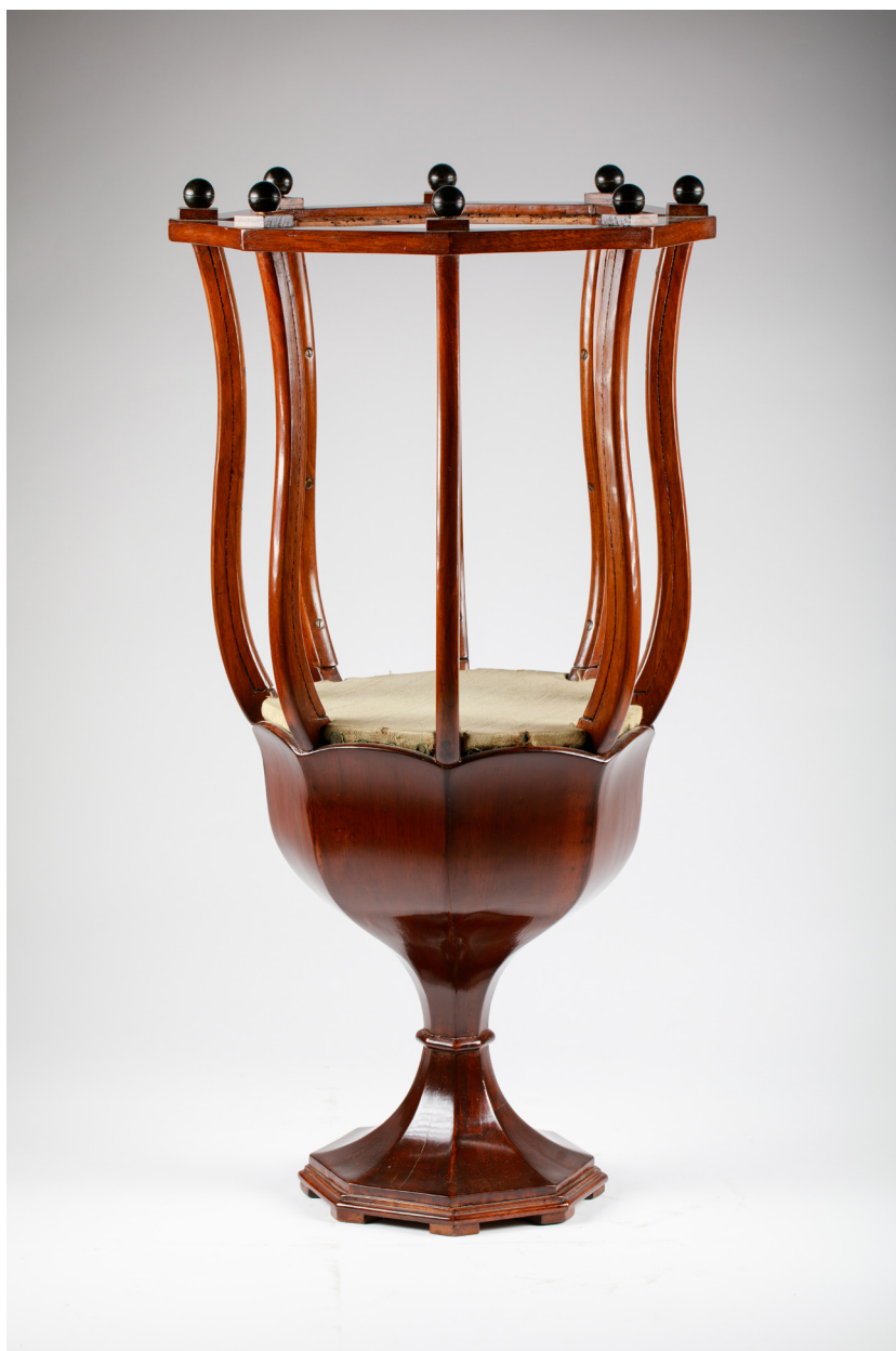
Koš na šití, osmiboký dřevo ořechové 1. polovina 19. století / severní Čechy