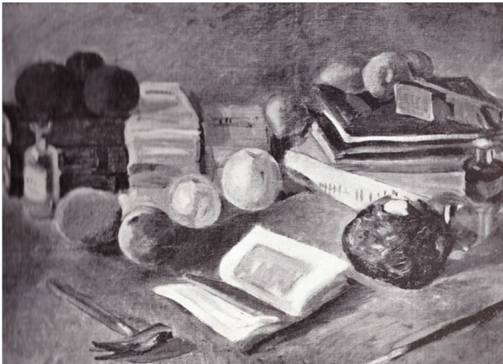
Bohumil Kubišta, Zátiší s jablky a knihami , olej na plátně, 50 × 64 cm, 1907, místo uložení neznámé.

24 Již v roce 1940 Městská spořitelna v Mladé Boleslavi podala na Kornella žalobu na zaplacení směny na částku 55 000 K včetně úroků; viz Amtsblatt des Protektorates Böhmen und Mähren 1940, roč. 5, s. 3424.